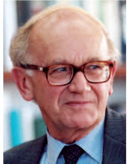
prof. emeritus Alexandre LAMFALUSSY 18. 01. 2007