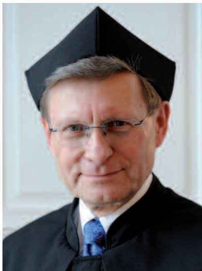
prof. Dr. hab. Leszek BALCEROWICZ 08. 12. 1999