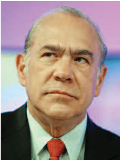
José Angel GURRÍA TREVIÑO 06. 12. 2012