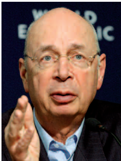
prof. Klaus SCHWAB 04. 11. 1996