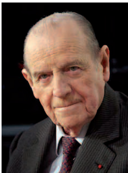
Dr. h. c. prof. Raymond BARRE 18. 05. 2000