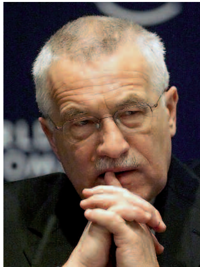
Dr. h. c. prof. Ing. Václav KLAUS, CSc. 07. 10. 2004