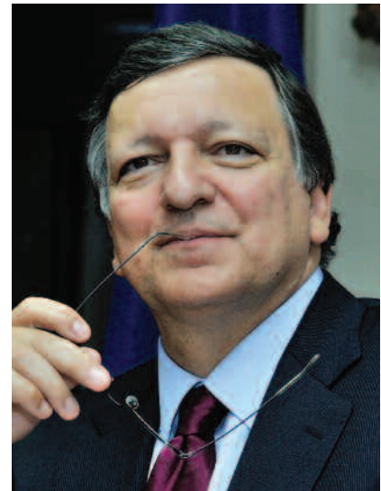
José Manuel DURÃO BARROSO 28. 04. 2014